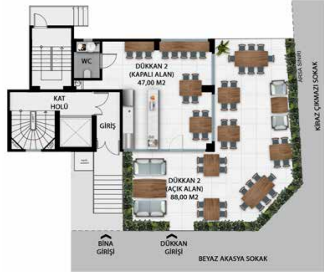
ZEMİN KAT PLANI