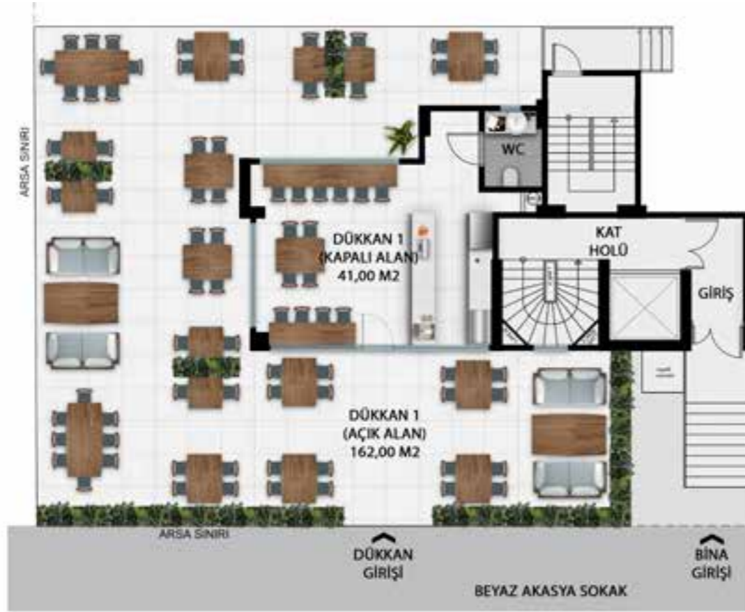
ZEMİN KAT PLANI

Kapalı Alan: 41,00 m 2 Açık Alan: 162,00 m 2